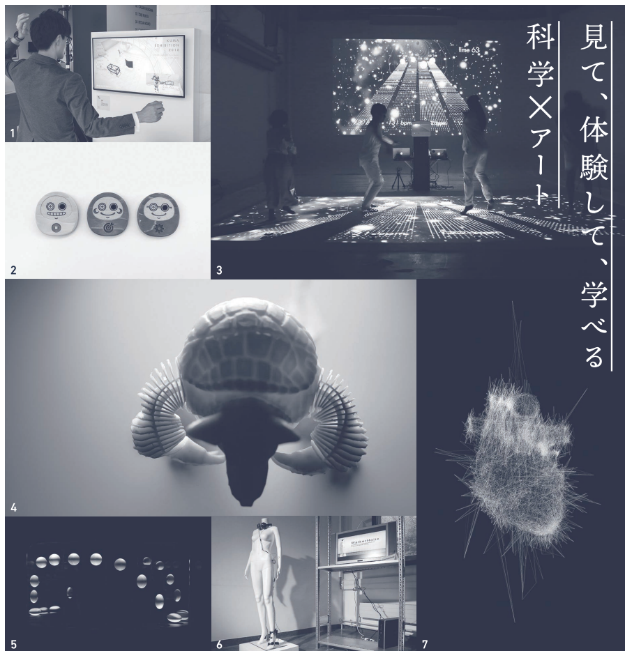
展示作品(一部) | 1. 勝部里菜・中澤満・益子宗・内山俊朗《engawa》/ 2. 櫻井亮汰・内山俊朗《Darumait》 3. 勝部里菜・宇田将史・益子宗・内山俊朗《heartbeat》/ 4. 若船美友・大嶋泰介・落合陽一《Coded Skeleton》5. 鈴木健太《Schnellraumseher》/ 6. 杉本実夏《Walkaholic 2》/ 7. Pascal Haudressy《Heart》